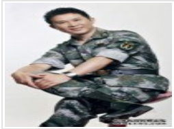
织梦织梦织梦织梦